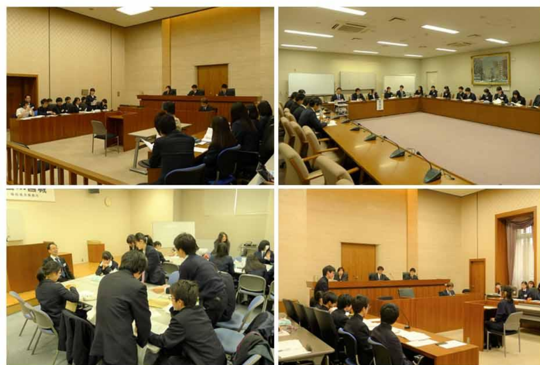
前回の模擬裁判大会の様子

申込方法 各校のご担当の先生を通じて、下記宛先まで郵送または F A X でご応募ください。 後日、招待状および事前配布資料をお送りいたします。